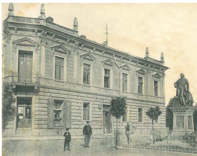
Pohled na budovu dnešní základní školy v Medlově s pomníkem France Josefa II.