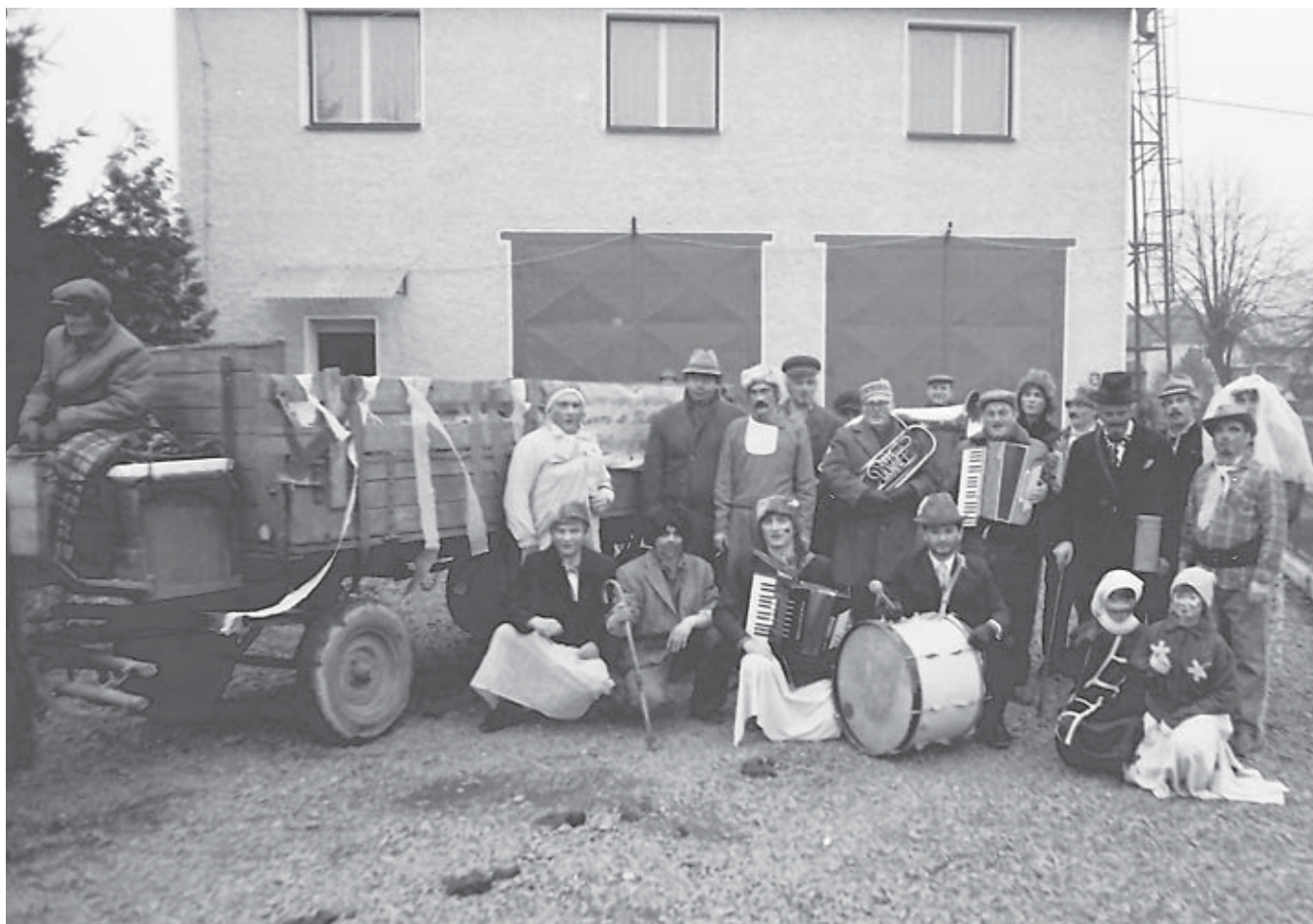
Skupinové foto účastníků jednoho z posledních masopustů v Medlově (r. 1989)

Obec Medlov, IČO 575 666 vydává a rozmnožuje měsíčník Obecní zpravodaj v počtu 650 ks výtisků.