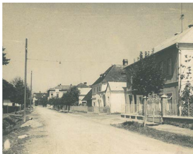
Pohled z roku 1930 na dnešní prostor před obecním domem s pohostinstvím v Medlově