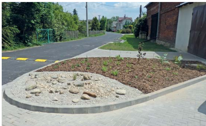
Naše poděkování za tvorbu a úpravu veřejné zeleně v obci patří manželům Krejzlíkovým z Hlivic