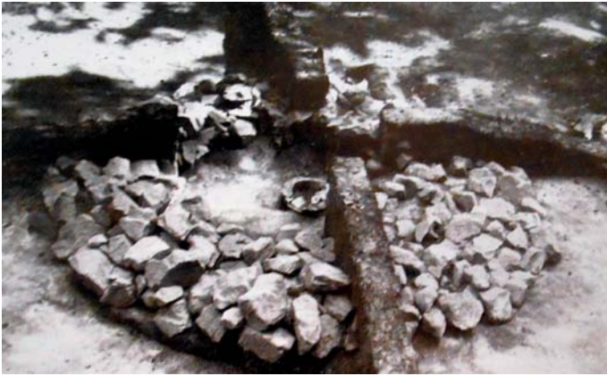
Kamenný základ jedné z mohyl s pohřební urnou uprostřed odkrytý během archeologického výzkumu v roce 1953.

vyorávali. Pro samotného zemědělce je rozbitý keramický hrnec bezcenný, ale ne pro člověka, který má úctu k předkům. Také učitelé tento zájem vzbuzovali ve svých žácích. V Medlově dokonce vznikla školní muzejní sbírka, která se skládala z nálezů, jež žáci našli na polích kolem vesnice. Přes množství kultur, které se v okolí Králové vystřídaly, není množstvím svých nalezišť ojedinělá. Celá Morava zvláště pak její úvaly vybízejí k obývání a byly také lidmi vždy hojně využívány. Od lovců mamutů až po současnost zde lidé žili a prožívali zde své každodenní starosti a bylo by dobré, aby si byl každý těchto kořenů vědom a byl na ně patřičně hrdý.