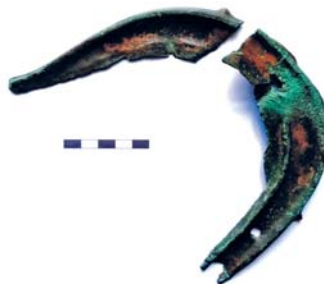
Jeden z rozlámaných srpů nalezených u Králové.

K vypracování článku byly použity kopie náleзовých zpráv z archivu bývalého městského muzea v Uničově, uložené v Archeologickém centru Olomouc. Dále byla použita následující literatura: