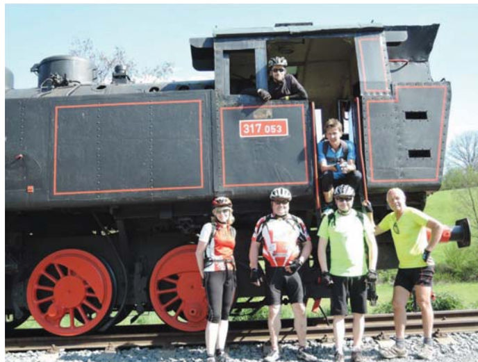
Železniční muzeum Lupěně

a to průjezdem Naučné stezky a přírodního parku Lanškrounské rybníky, která se rozkládá západně od Lanškrouna. Je součástí příměstské rekreační zóny areálu přírodního koupaliště u rybníku Dlouhý. Skutečná nádhera.