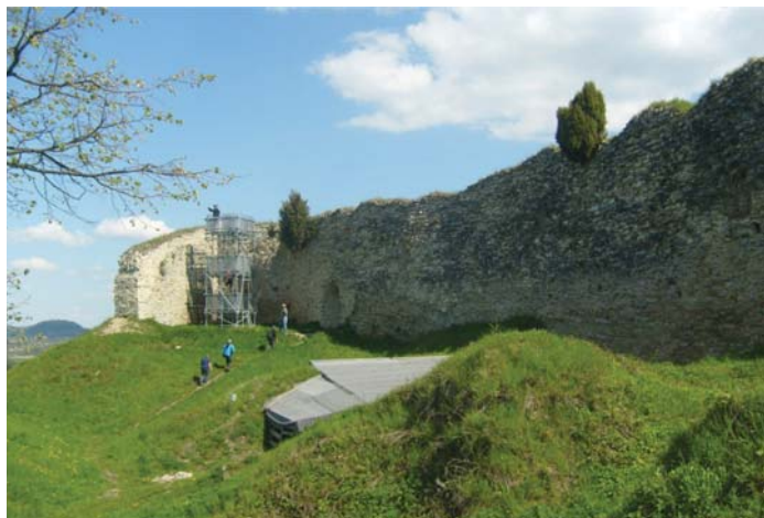
Zřícenina hradu Lanšperk

Tak Kanada se nám blíží (teda zatím jenom ta česká, na tu opravdovou budeme muset ještě našetřit) a my jsme se dohodli, že jednu předsváteční sobotu uděláme malé soustředění a něco naježdíme, abychom byli na hlavní akci v kondici. Návrhů kam se pojedete, padalo hodně. Nakonec zvítězila varianta «Údolí Tiché Orlice», jelikož nás k němu vázal rest z velikonočního výletu, kdy jsme nenavštívili zříceninu hradu Lanšperka, což měl být nejvyšší bod tohoto výletu.