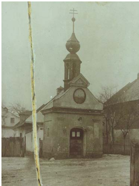
(foto kapličky z roku 1903, Zemský archiv v Opavě, pobočka Olomouc fond VS Úsov, kt. 137, inv. č. 922)

V Králové na návsi sloužil obyvatelům k takovýmto setkáváním