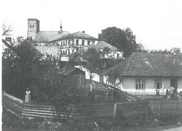
Pohled na budovu školy a kostela ze silnice směrem na Královou

V letošním roce otevíráme novou rubriku, a to „Okénko do obrazové historie naší obce“. V každém čísle našeho zpravodaje uveřejníme dvě fotografie, abychom si připomenuli, jak se naše obec mění v čase.