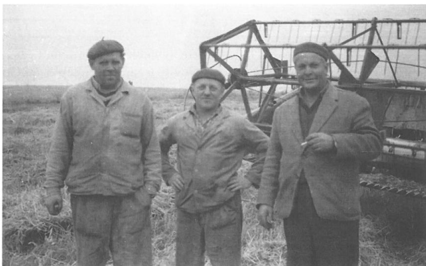
Fotografie ze žní a dožinek v r. 1964.