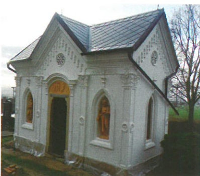
Opravená hrobka „Familie Vogt-Coufal“