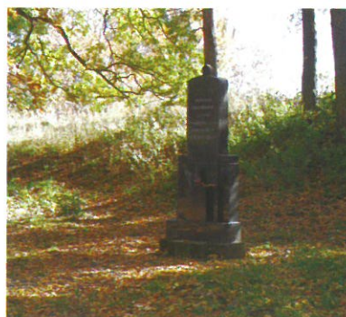
Prostor pomníku padlých volyňských Čechů na „Skalkách“ v Medlově (před a po úpravě)