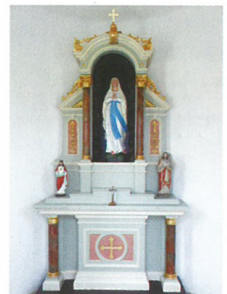
Rekonstruovaný oltář v Králové