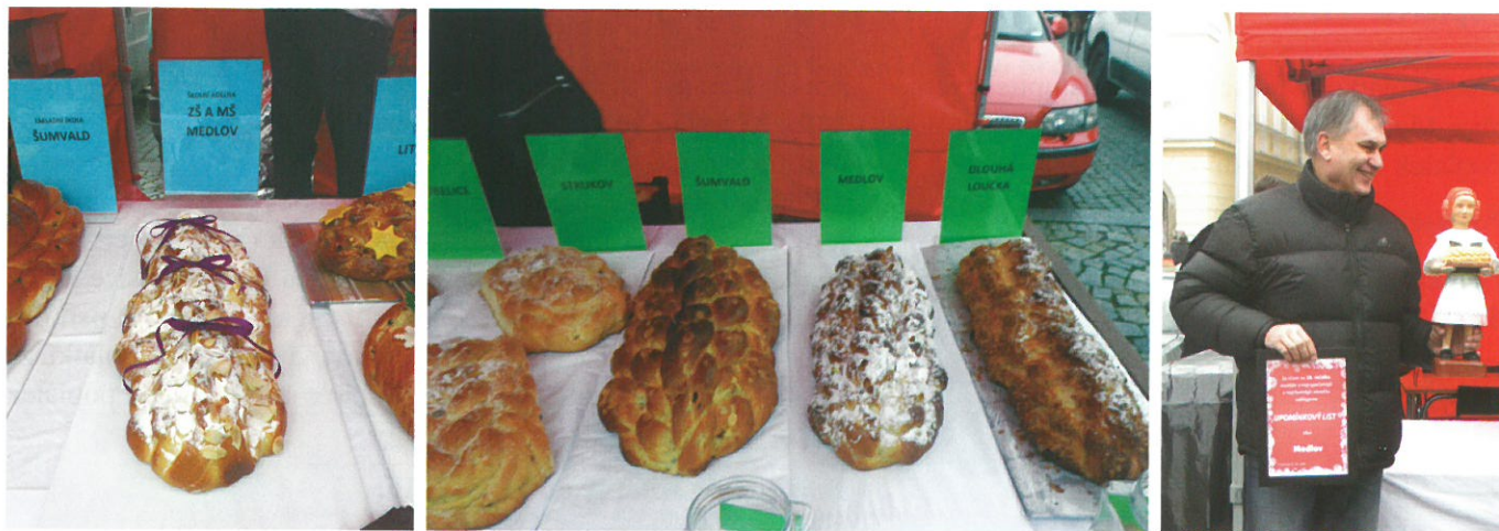
Putovní cena „Maruška-pekařka“ se tak stala natrvalo majetkem obce Medlov. V budoucnu zaujme své místo v chystaném muzeu.