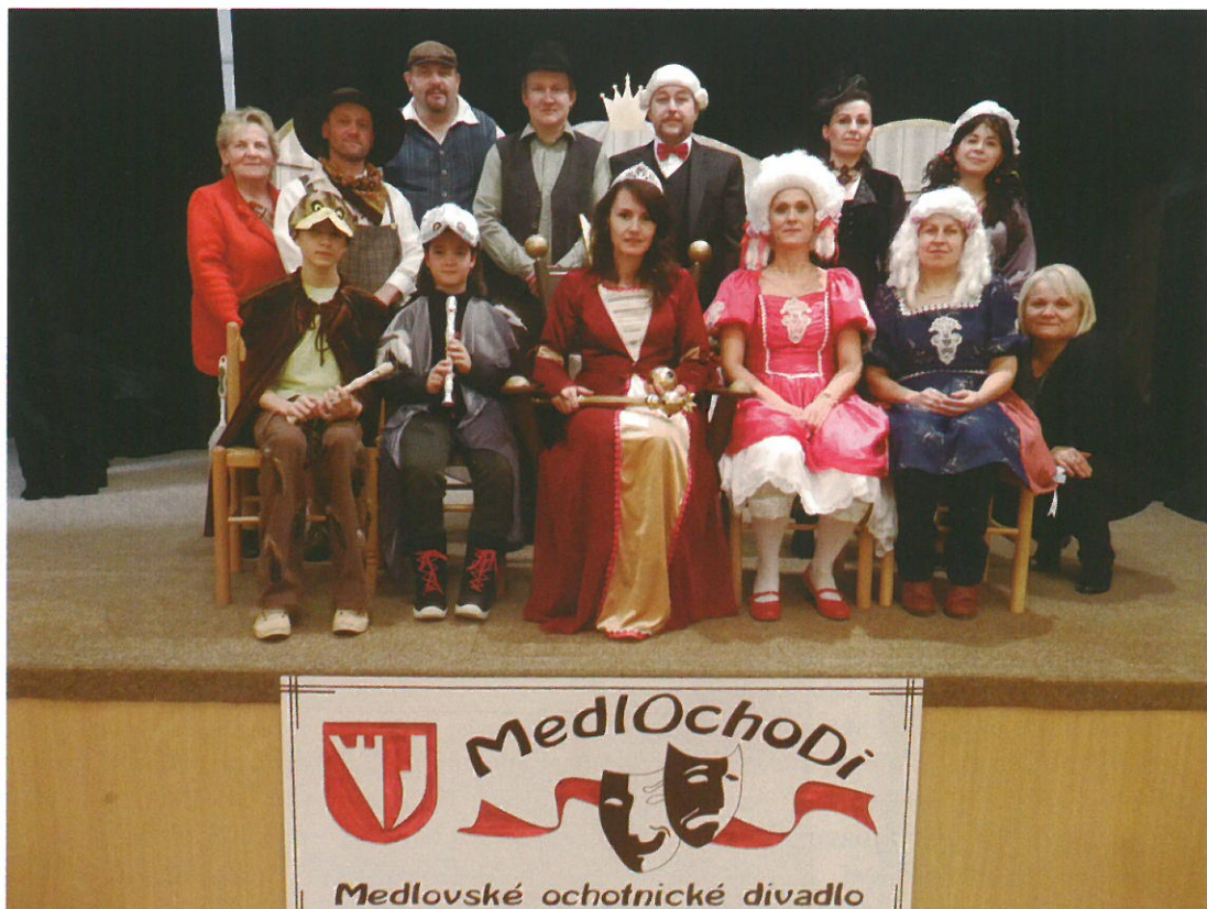
Členové Medlovského ochotnického divadla

Velkým překvapením pro všechny bylo představení „Třetí sudba“ v podání znovu obnoveného divadelního spolku v Medlově, který vystupuje pod názvem „MedlOchoDi“. Výkony až na profesionální úrovni ohromily nejen medlovské, ale i přespolní diváky. Vyprodat hned třikrát sál předčilo očekávání nejen samotných ochotníků. Odezva takového úspěchu na sebe nedala dlouho čekat. V lednu zajíždějí naši ochotníci s tímto představením do Klopiny. O jejich vystoupení jednáme i s Městským kulturním zařízením v Uničově. Nabídnuto nám bylo také možné vystoupení na setkání amatérských divadelních spolků, které by se v letních měsících mělo uskutečnit na zámku v Úsově. Přejme si jen, aby tento elán našim ochotníkům vydržel.