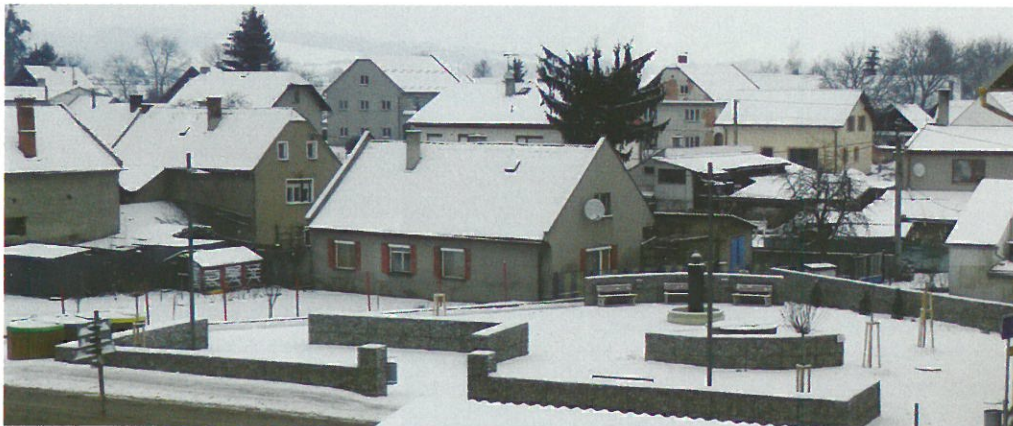
Nově vybudovaný park v Medlově (za bývalým obecním úřadem)

Rok 2015 byl co do investiční výstavby velmi bohatý. Z realizovaných akcí bych zmínil zejména vybudování parku v Medlově za starým obecním úřadem. Chybí dokončit některé ozdobné prvky kašny a studny a oset trávniky. Věřím, že v jarních měsících si budeme moci naplno vychutnat tyto nově vzniklé prostory. Konečně došlo na propojení obou sálů v Obecním domě v Medlově. Byly vybudovány nové parkovací plochy a chodníky. Téměř dokončena byla příprava pozemků pro výstavbu 5RD v Zadním Újezdě. Demolicí objektu Medlov 10 (bývalé „Klabačkov“) bude vytvořeno zázemí pro čtyři nové stavební pozemky. Nezapomněli jsme loni ani na naše kulturní památky. Byla dokončena rekonstrukce kaple v Králové, včetně jejího oltáře. Započata byla rekonstrukce oltáře kaple v Hlivicích. Opravena byla hrobka „Familie Vogt-Coufal“ na hřbitově v Medlově. Tato akce byla částečně financována z dotačního programu Ministerstva pro místní rozvoj. Z vašich ohlasů se oprava této kulturní památky místního významu velmi povedla. Z toho máme velkou radost. Konečně došlo také na tolik očekávanou úpravu prostoru kolem pomníku padlých volyňských Čechů a rudoarmějců padlých ve II. světové válce na „Skalkách“ v Medlově.